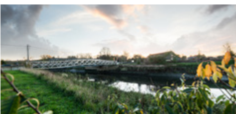
De Zennebrug in Leest