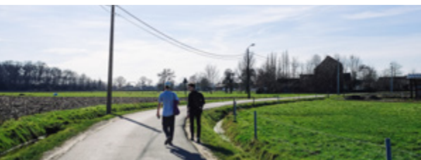
Agrarisch landschap, Hombeek