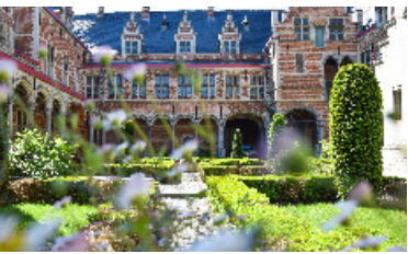
Palais de Marguerite d'Autriche