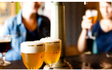
Brasserie Het Anker, Gouden Carolus